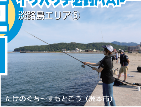
たけのぐち〜すもとこう (洲本市)

■おすすめは洲本川河口北側にある炬口漁港公園から伸びる防波堤。防波堤根元に無料駐車場、トイレがありアクセスは最高。潮通しがよくいろいろな魚種がねえ青物、ヒラメなど大物も多い。秋はタチウオの夜釣りで賑わう。子供連れなら手すりがある駐車場前護岸が安全。洲本港は赤灯波止が立入禁止になったので白灯波止が各種釣りのベストポイント。炬口漁港から渡船利用の一文字ならさらに釣果確実。海水浴場、温泉、ホテルなどが隣接した一大レジャースポットだ。