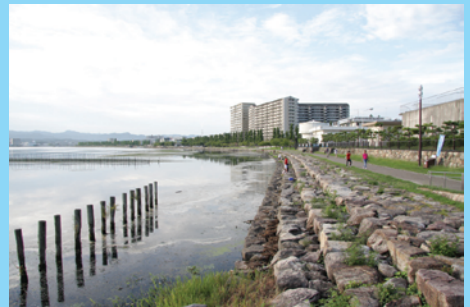
大津湖岸なぎさ公園の護岸は、琵琶湖文化館あたりと同様に階段状になっており非常に釣りやすい