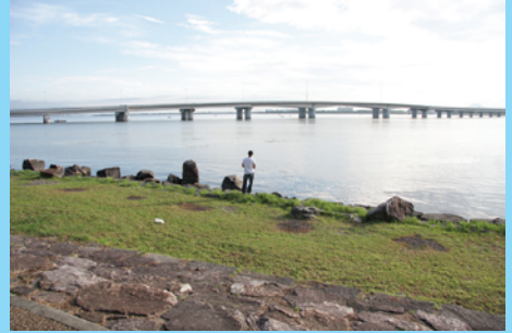
膳所城跡公園の周囲は足場がよく釣りやすいが非常に浅いので南のなぎさ公園の護岸に比べると期待薄。間近に近江大橋が見える