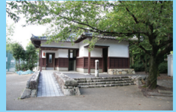
膳所城跡公園内にはトイレや飲料の自動販売機もあるので、家族連れには最適