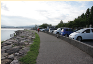
車は大津湖岸なぎさ公園の有料駐車場に止める。トイレもあるので便利